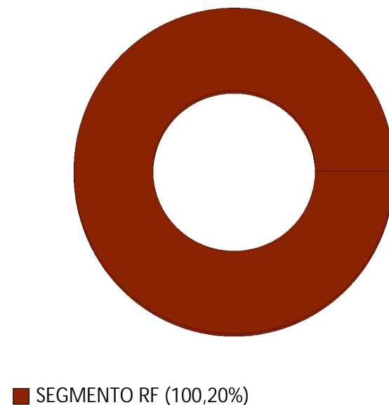
POSIÇÃO CONSOLIDADA POR TIPO DE ATIVO*