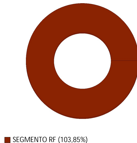
POSIÇÃO CONSOLIDADA POR TIPO DE ATIVO*